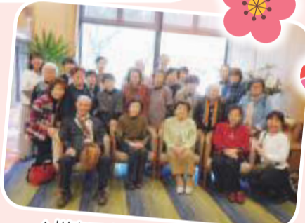
▲川南西支部 支部バス旅行 紅葉が最高でした