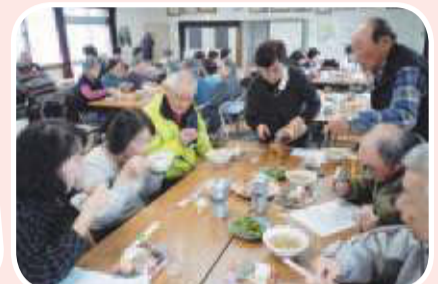
▲森合支部 学習会・芋煮会 みんなで美味しくいただき ました!