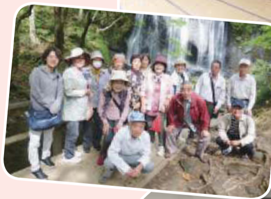
▲瀬上第2支部 支部バス旅行 不動沢滝まで散 策しました