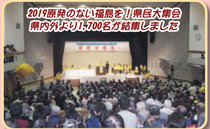
2019原発のない福島を！県民大集会 県内外より1,700名が結集しました