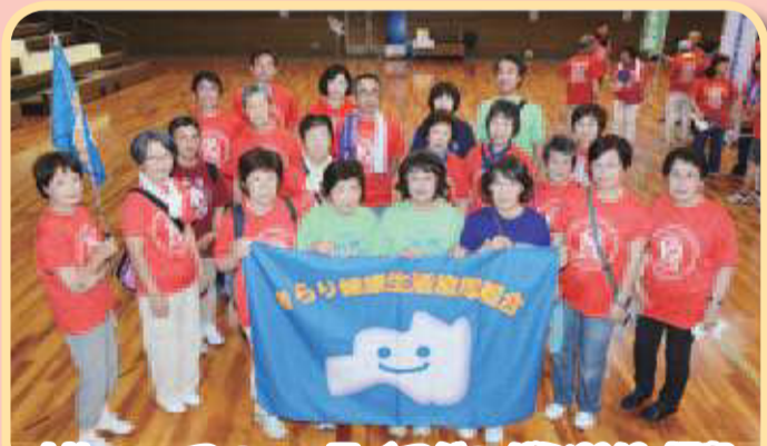
リレー・フォー・ライフジャパン2019 福島 今回で10回目の開催となりました