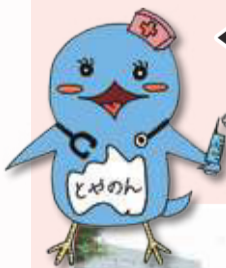
▲とやのクリニック イメージキャラクター 「とやのん」