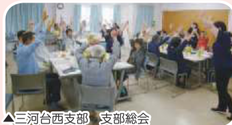
▲三河台西支部 支部総会 ラフターヨガでスッキリ笑顔!