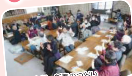
▲清明支部 新春のつどい 笑顔あふれる楽しい交流会でした