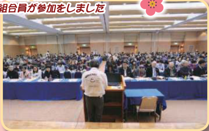
ツク組合員活動交流集会 の組合員が参加をしました