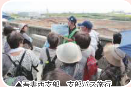
▲吾妻西支部 支部バス旅行 気仙沼市東日本大震災遺構・ 伝承館視察