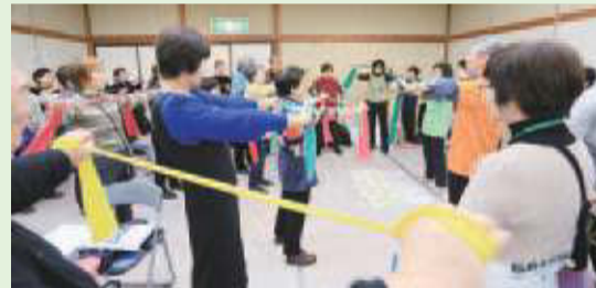
▲きらり健康生協コーナーで信夫支部セラバンド体操の紹介と実技を披露