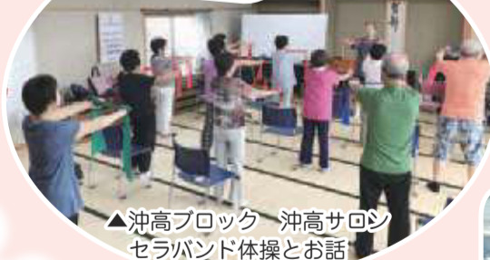
▲沖高ブロック 沖高サロン セラバンド体操とお話