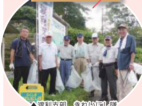
▲渡利支部 きれいにし隊 年3回の地域清掃活動を行っています