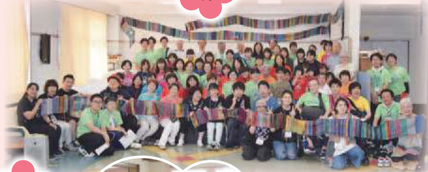
▼2019にじいろフェスタ