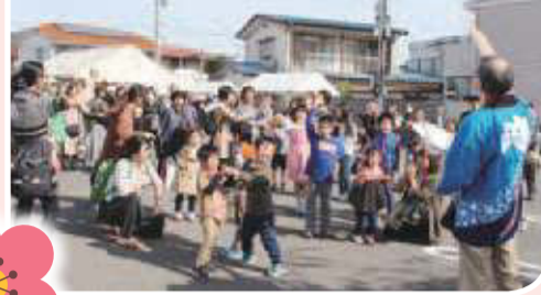
▼きらり健康まつり in すかわ 500名を超える来場者がありました