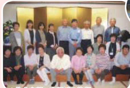
▲佐倉支部 支部バス旅行 久しぶりの支部旅行 三春馬場の湯