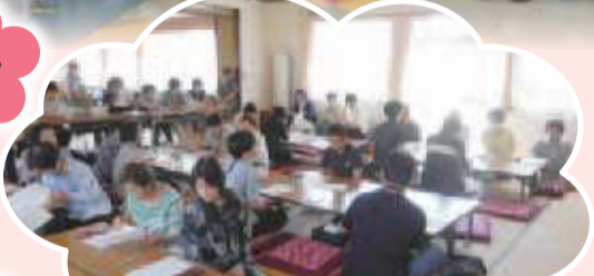
▲笹谷支部 支部総会兼組合員のつどい 支部長の体操や歌で盛り上がりました