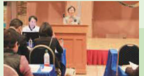
▲きらり健康生協「セラバンド体操」の取り組みを紹介