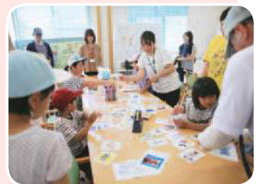
▲せのうえ健康まつり 多くの来場者が見えました