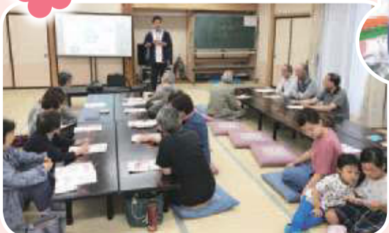
▲矢野目ブロック 口腔ケア学習会 いつまでもおいしく食べるために