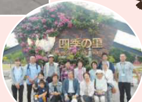
▲川北東支部 支部バス旅行 バラ園が見ごろでした