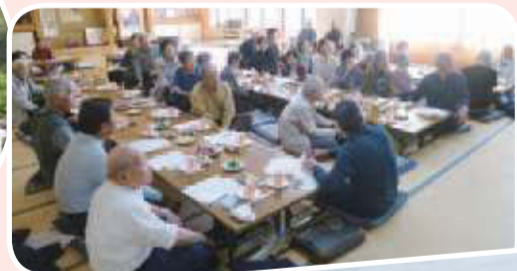
▲杉妻支部 支部芋煮交流会 初めての企画となりましたが、みんなで おいしい芋煮を味わ いました