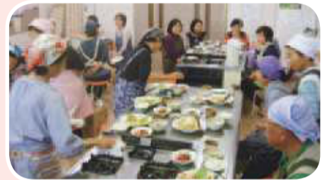
吉井田支部 調理実習▶ 上手に、美味しく「す こしお」料理ができま した