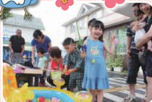
▲とやのクリニック 夏休み子どもまつり