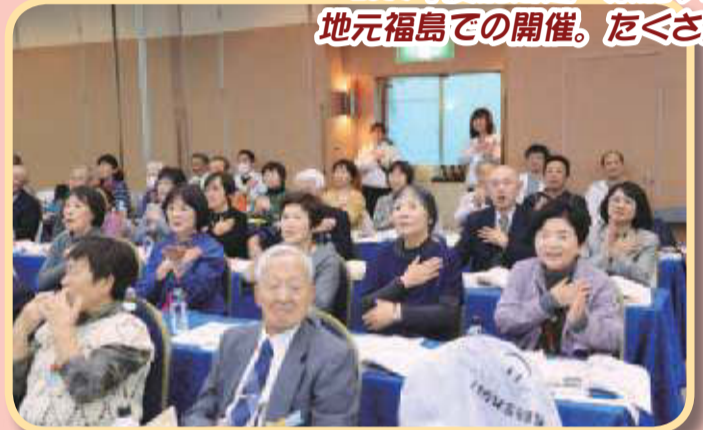
2019年度北海道・東北ブロック 地元福島での開催。たくさん