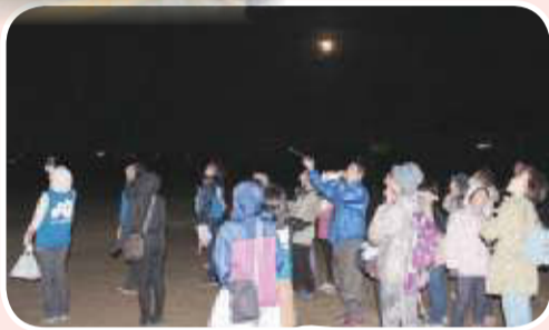
▲十六夜ウォーク & 天体観測 大きなお月様が見 えました