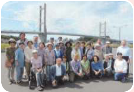
▲川北西支部 支部バス旅行 お魚料理を堪能しました