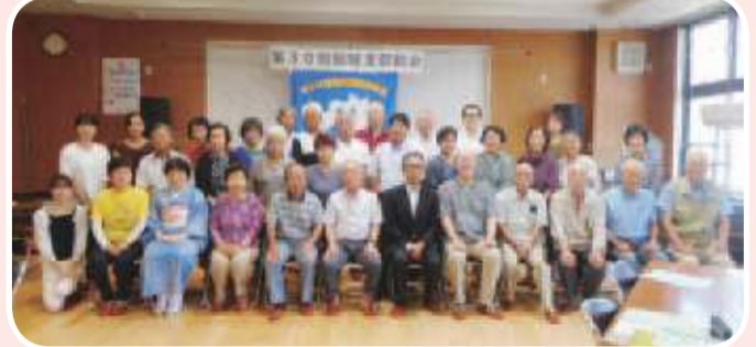
▼飯坂支部 支部総会 歌声喫茶で盛り上がりました