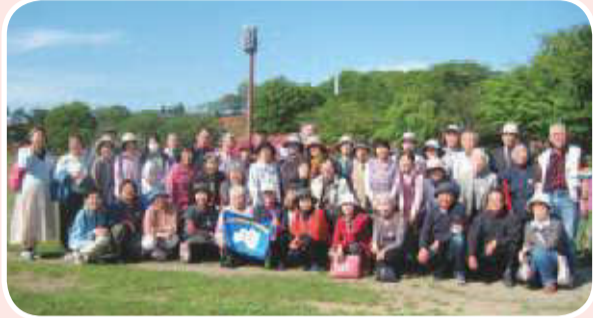
▲吾妻東支部 支部バス旅行 あしががフラワーパークで