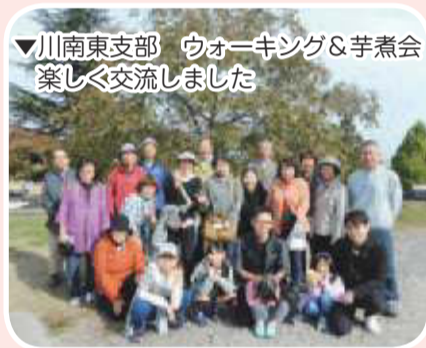
▼川南東支部 ウォーキング&芋煮会 楽しく交流しました