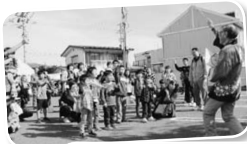
「きらり健康まつり」のすかわ「みんなでジャンケン」

私たちの理念である「いのち輝く明日のために、健康づくり、仲間づくり、まちづくり、みんなでつくるみんなの安心」のため、これからも医療生協の活動をすすめて行きましょう。