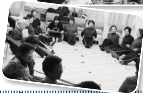
「セラバンド体操スキルアップ講座」