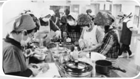
「保健委員会学習会」「減塩調理実習」