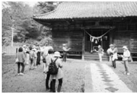
①大宮神社 本殿のつくりや彫刻は一見の価値がある

九月二十九日(火)薄曇りの好天気。初めてのウォーキングを兼ねた史跡巡りには二十二人が参加した。