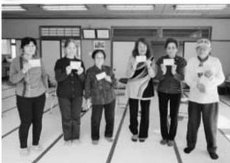
▲毎月、出資金を持って集まります

只今、生協強化月間の期間中です。今年テーマは、コロナ禍の中でも地域のつながりを大切に「小さな集まり」をつくることと、生協活動の基盤を強くする「出資金増やし」(増資)期間となります。現在、地域では強化月間の提案を受け様々な活動が行われています。ぜひ、参考にし、生協強化月間を元気に取り組みましょう!