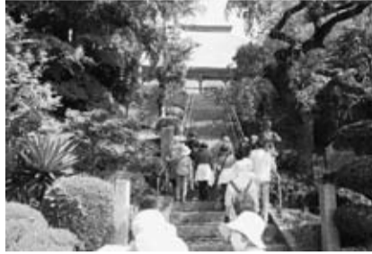
②長秀院 1617年11月12日に開闢、階段は石内にあった旧長秀院(1845年焼失)から移した。

蓬萊町の東を取り巻くように、田沢地区がある。昔、田沢街道といわれ、阿武隈川を越えて、福島をめざした人々の重要な道であった。