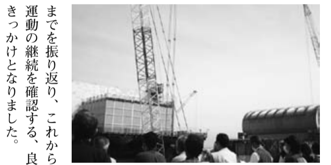
▲2号機建屋(左)と3号機建屋(右)

物は安全となるまで数十万年を要する。現世代のたかたか五十年の電気のために、気の遠くなるような後世代までに迷惑が及ぶ。発電者として東電社員に何か思いはあるか」これに対し、東電社員「国の方針に基づいて進めてきたとはいえ、目先の事を優先して廃棄物などのことまできちんと考えずに走ってきたのだと思う」私は、「東電社員よくぞ言った」と感じました。