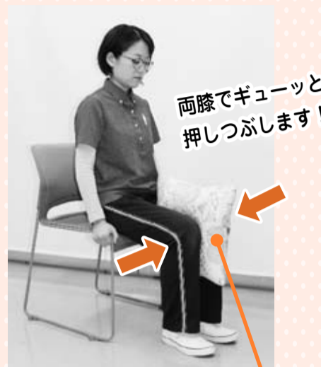
硬めのクッション