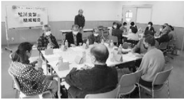
▲理事だけでなく、近隣の支部からも出席いただきました

★組合員数.....19,860名 ★出資総額.....603,894,000円 ★一人平均出資額.....30,408円