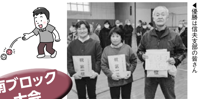
▲フェアプレーを期待します～!