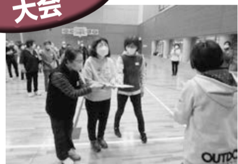
▲優勝は三河台東支部の皆さん

三月十九日に中西ブロック、二十六日は南ブロック支部の皆さんによるポッチャ大会が開催されました。五月に開催される生協全体の大会を前に精鋭が集いました。