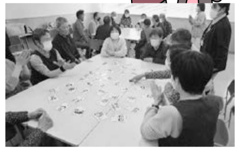
▲総会の後は、認知症予防カルタで大盛り上がり。読み札より笑い声の方が大きかったとか

が、認知度や活動もまだまだ発展途中ですし、一番近い事業所であることやのクリニックから約十km、車で二十五分ほどかかる距離で、気軽に利用するには少しハードルがあります。また、松川地区は南北に約七kmもある細長い地域で、山岳地域でもあるため組合員さんがまだ点々としかおらず、機関紙配布も厳しい状況にあります。