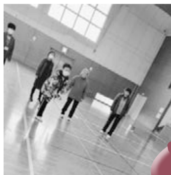
▲白熱のプレーが続きました!!