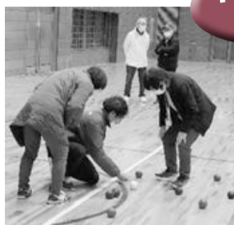
▲ううむ...これは青が近いかな